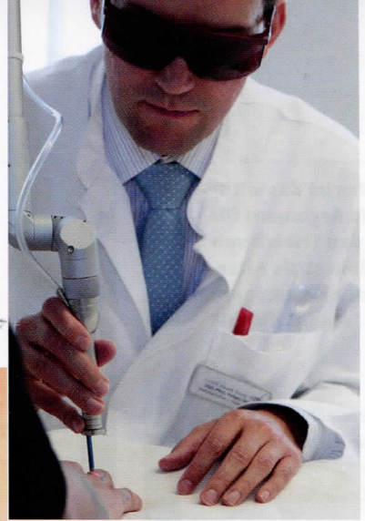
Laserbehandlung von Tattoos