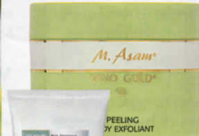
ABREIBUNG „Vino Gold Peeling“, M. Asam, ca. 24 € (über QVC)