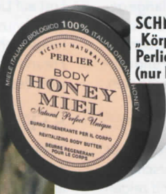
SCHMEICHLER „Körperbutter“, Perlier, ca. 10 € (nur bei Douglas)