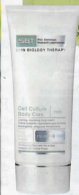
ANTI-AGING „Cell Culture Phase Body Care Rich“, SBT, ca. 48 €