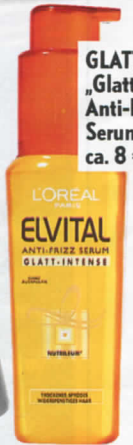
GLATTMACHER „Glatt-Intense Anti-Frizz Serum“, L'Oréal, ca. 8 €