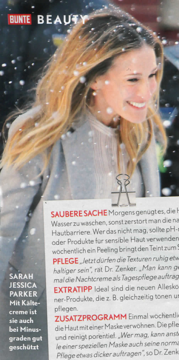
SARAH JESSICA PARKER Mit Kältecreme ist sie auch bei Minusgraden gut geschützt