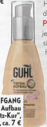
TIEFGANG „Mandelöl Aufbau & Schutz-Kur“, Guhl, ca. 7 €