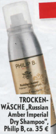
TROCKENWÄSCHE „Russian Amber Imperial Dry Shampoo“, Philip B, ca. 35 €