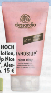
HÄNDE HOCH Handlotion, „Hands! Up Nice Day“, Alessandro, ca. 15 €