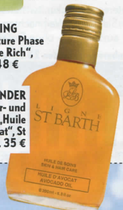
ALLROUNDER Körper- und Haaröl „Huile d'Avocat“, St Barth, ca. 35 €