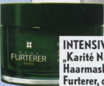
INTENSIVPFLEGE „Karité Nährende Haarmaske“, Furterer, ca. 22 €