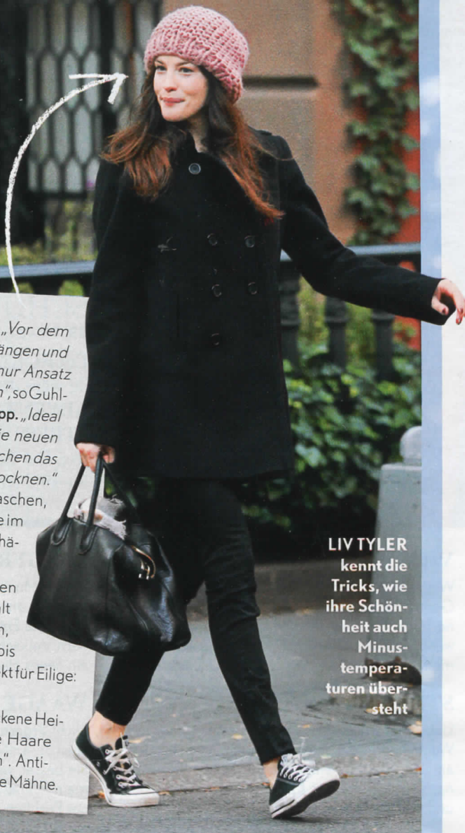
LIV TYLER kennt die Tricks, wie ihre Schönheit auch Minustemperaturen übersteht

HAUT & HAAR bei klirrender Kälte – ist doch kein Problem!