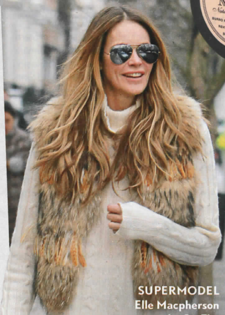
SUPERMODEL Elle Macpherson heißt „The Body“ – und pflegt ihn intensiv