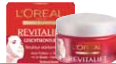
Gesicht, Konturen und Hals