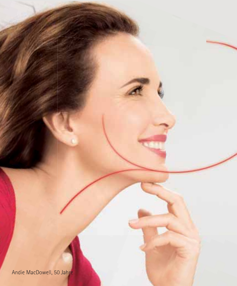
Andie MacDowell, 50 Jahre