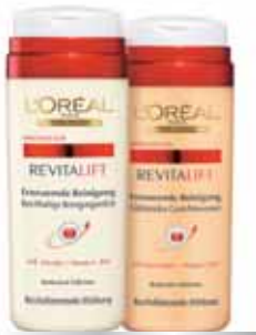
Reichhaltige Reinigungsmilch Glättendes Gesichtswasser