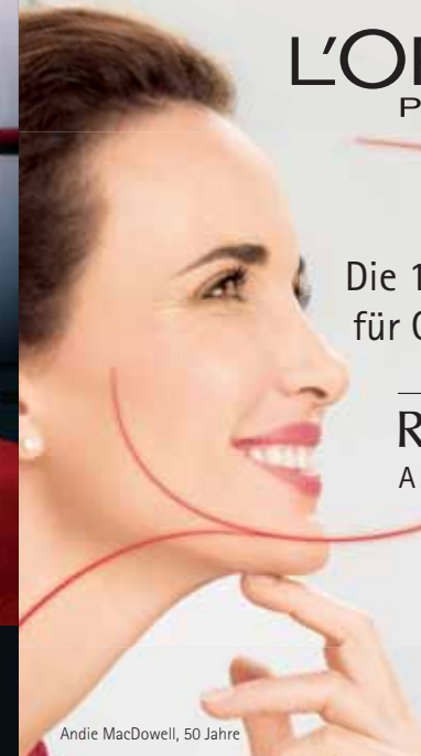
Andie MacDowell, 50 Jahre

Technologische Revolution Die 1. struktur-stärkende Pflege für Gesicht, Konturen und Hals