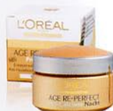
AGE RE-PERFECT Nachtpflege