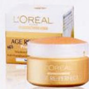
AGE RE-PERFECT Tagespflege