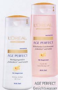
AGE PERFECT Reinigungsmilch