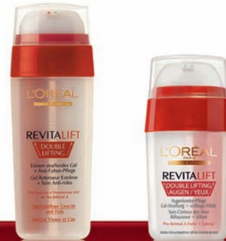
DOUBLE LIFTING DOUBLE LIFTING AUGEN

Um Ihre Haut sofort zu liften und Ihre Gesichtszüge zu verfeinern: