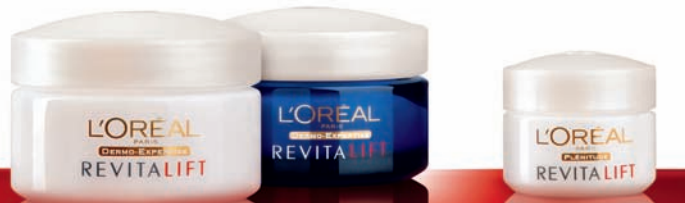
SOIN DE JOUR