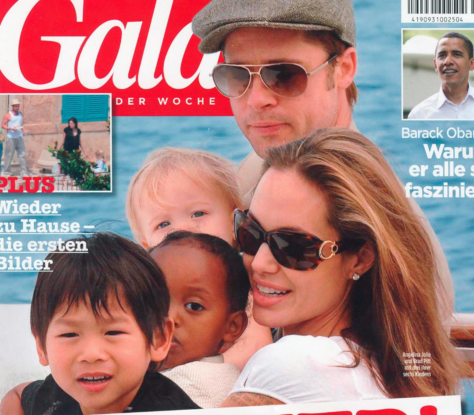
Angelina Jolie und Brad Pitt mit drei ihrer sechs Kindern