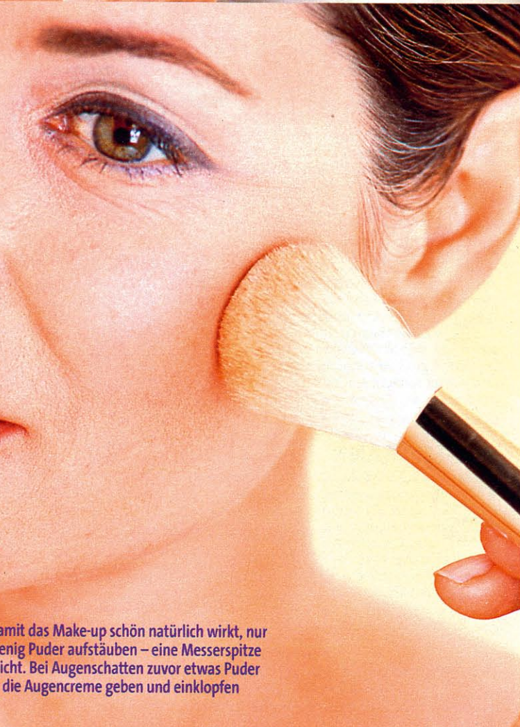
damit das Make-up schön natürlich wirkt, nur wenig Puder aufstäuben – eine Messerspitze reicht. Bei Augenschatten zuvor etwas Puder auf die Augencreme geben und einklopfen

Richtig auftragen: Die Haut sollte möglichst fettfrei sein. Die Gesichtcreme vor dem Auftragen des Puders gut einziehen lassen oder mit einem Kosmetiktuch abtupfen. Dann etwas Puder in den Deckel schütten, mit einem dicken Pinsel aufnehmen, am Rand des Döschen abklopfen und kreisend von der Mitte nach außen hin aufstäuben. Beim ersten Mal nicht zu viel Farbe aufnehmen. Bei Bedarf lieber eine zweite Schicht auftragen.