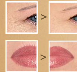
Veranschaulichung der Effekte

Eine optimale Basis für Make-up wird geschaffen.