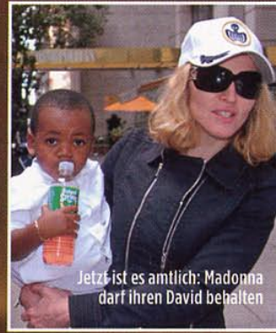
Jetzt ist es amtlich: Madonna darf ihren David behalten

EXKLUSIV MADONNA Geheimdokumente über ihr Familienleben