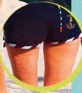
KATE MOSS, 33, Topmodel hat eine Top-Figur – aber auch kleine Dellen an den Schenkeln