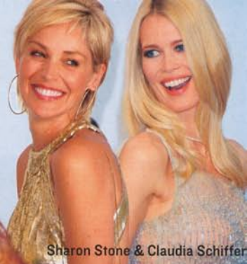
Sharon Stone & Claudia Schiffer

Filmfestival Die Königinnen von Cannes Die größte Party der Welt auf 17 Seiten s. 20