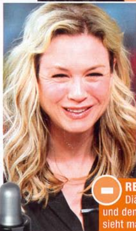
- RENÉE ZELLWEGER, 37 Diät-Jo-Jo für die Filme und den Stress im Privatleben sieht man ihrer zarten Haut an

TIPP Gegen Doppelkinn: Kaubewegungen machen und dabei Kopf abwechselnd nach hinten und vorn neigen